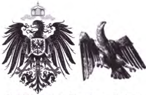
Präsidium des Deutschen Reichs